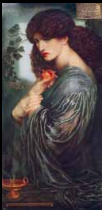
D.G. Rossetti - PROSERPINA 1874

A metà del XIX secolo i Preraffaelliti promuovono il ritorno ad un'arte simbolica di carattere prerinascimentale.