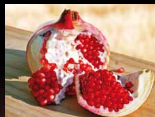
Valutazione qualitativa dei frutti e di altri organi della pianta.