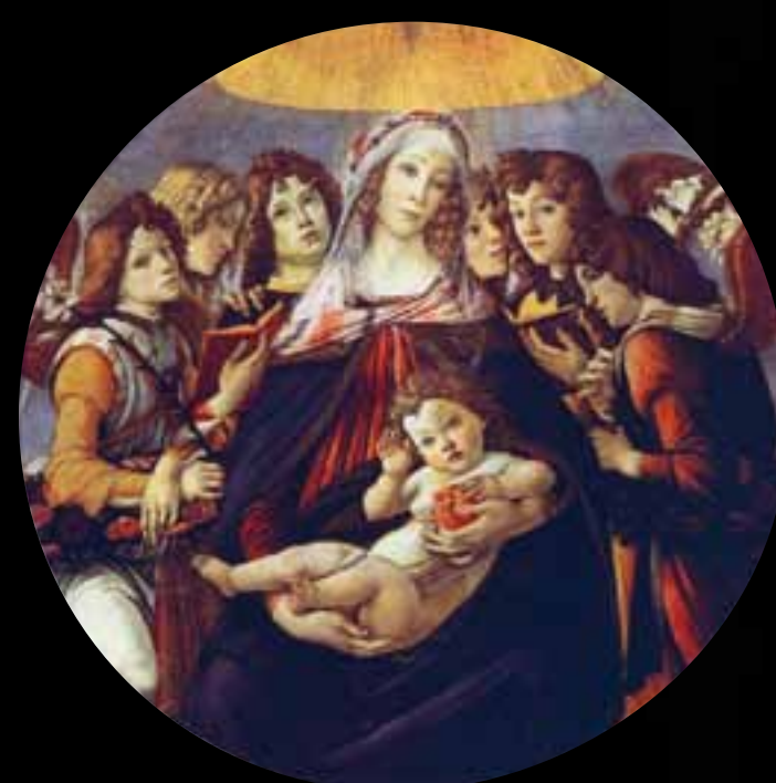
S. Botticelli - LA MADONNA DEL MELOGRANO 1487

Il simbolismo in epoca rinascimentale si attua in modalità più complesse che consentono interpretazioni diverse anche in opere coeve perdendo il carattere univoco che lo ha caratterizzato nelle epoche precedenti.