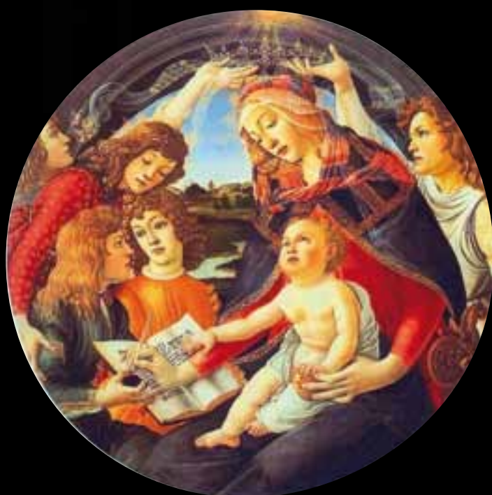
S. Botticelli - LA MADONNA DEL MAGNIFICAT 1481

Il simbolismo in epoca rinascimentale si attua in modalità più complesse che consentono interpretazioni diverse anche in opere coeve perdendo il carattere univoco che lo ha caratterizzato nelle epoche precedenti.