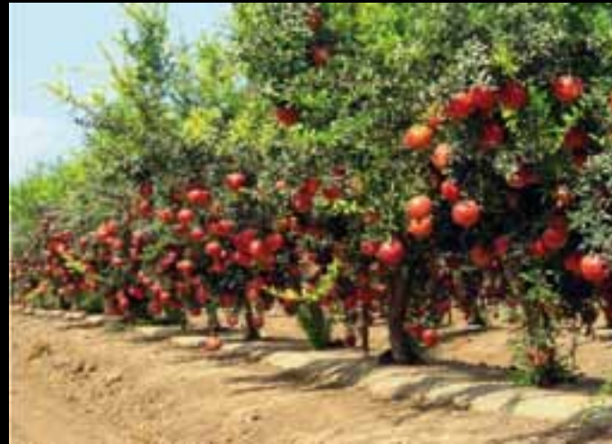
Progetto Campo - Collezione