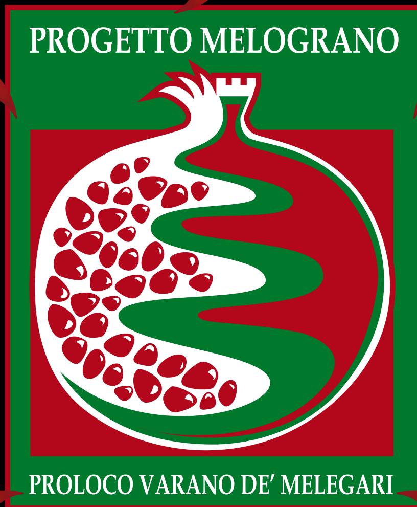
Salute e benessere