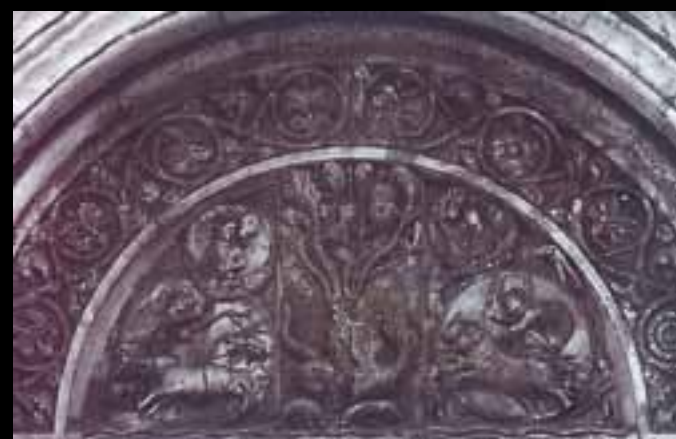
B. Antelami - LEGGENDA DI BAHARLAM Battistero di Parma - XII sec.

La narrazione simbolica ha la finalità di educare al buon comportamento il fruitore in un contesto culturale fortemente religioso.