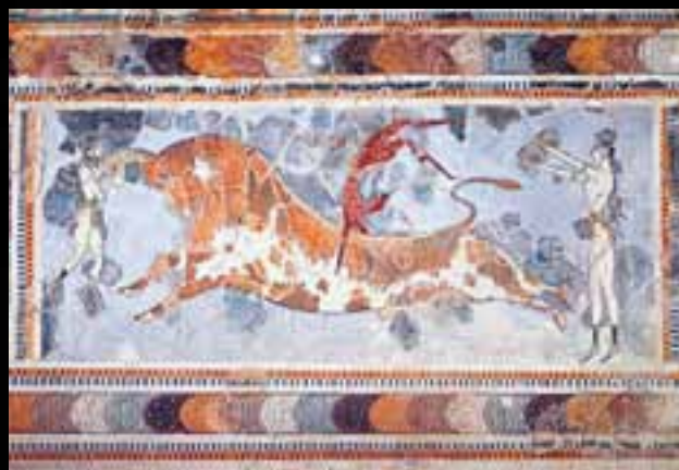
IL GIOCO DEL TORO Palazzo di Cnosso - 2000 a.C.

"Il simbolismo ha da sempre accompagnato l'evoluzione del linguaggio artistico"